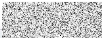
Úsek pojištění hospodářských rizik Kooperativa pojišťovna, a.s., Vienna Insurance Group