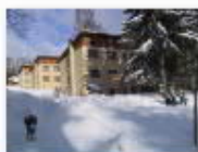
3 VOLAREZA Bedřichov - depandance zima