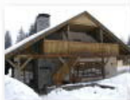
19 VOLAREZA Bedřichov - restaurace U Medvěda