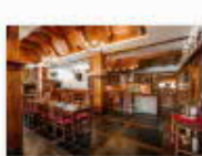
21 VOLAREZA Bedřichov - U Medvěda interier