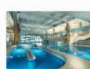
23 VOLAREZA Bedřichov Vodní ráj