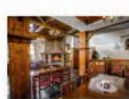
22 VOLAREZA Bedřichov - U Medvěda interier