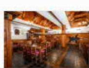
20 VOLAREZA Bedřichov - U Medvěda interier