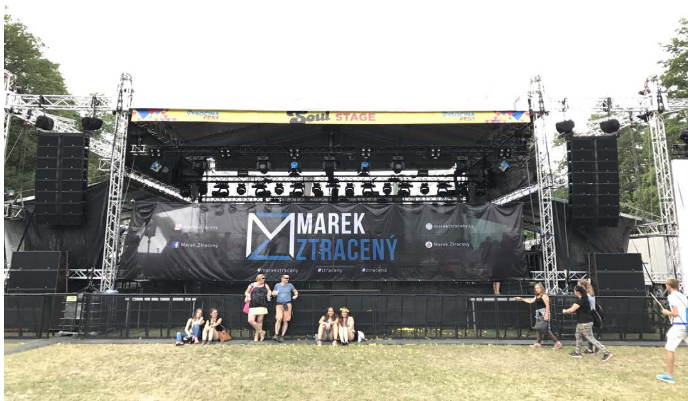
Obrázek č. 2: Plachta na zvukovou zkoušku