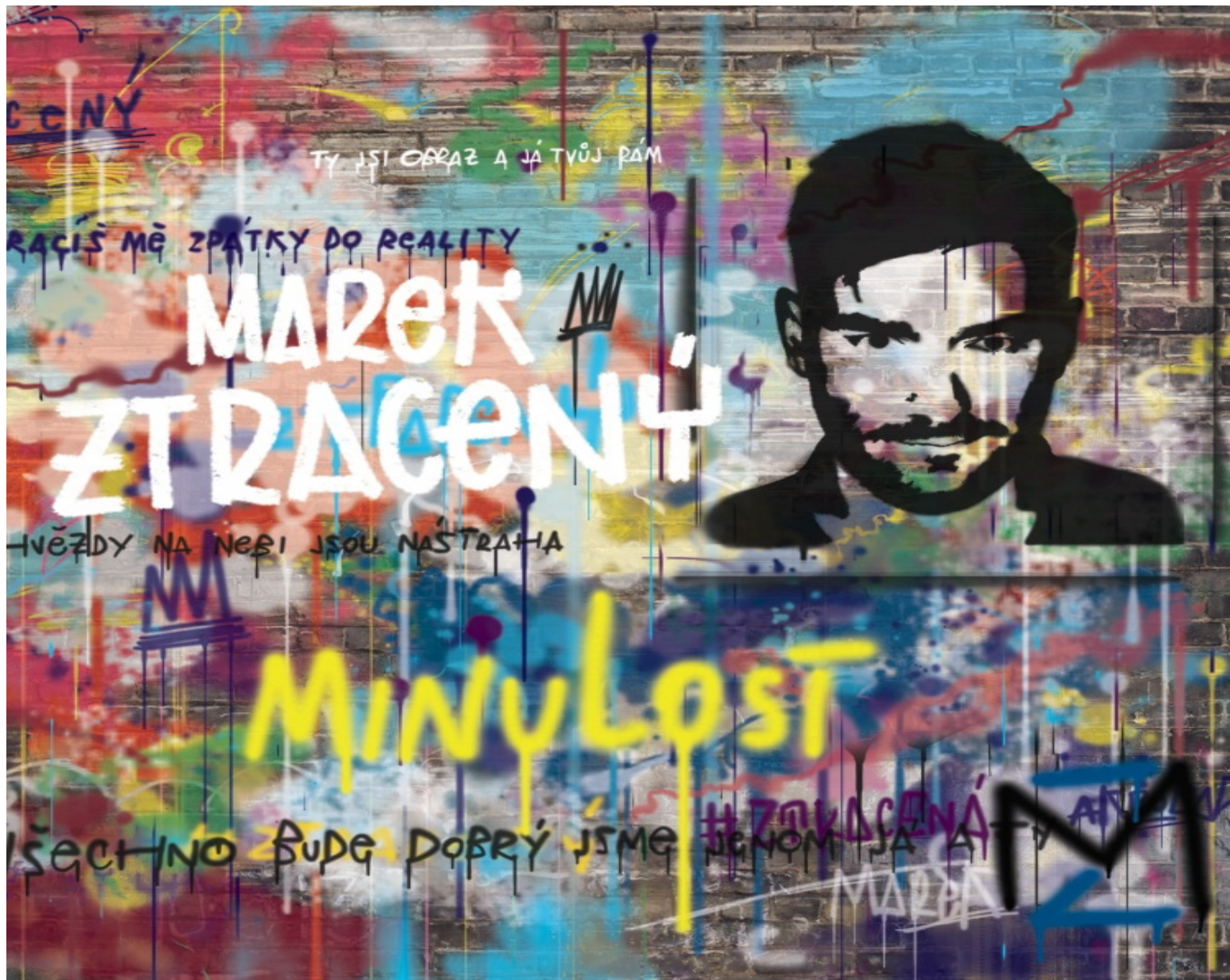
Obrázek č. 1: Backdrop