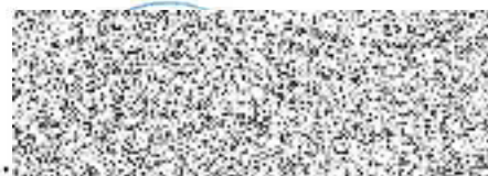
..... razítko Středočeského kraje

radní pro oblast regionálního rozvoje, cestovního ruchu a sportu