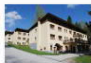
4 VOLAREZA Bedřichov - depandance léto