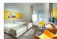
5 VOLAREZA Bedřichov pokoj hotel